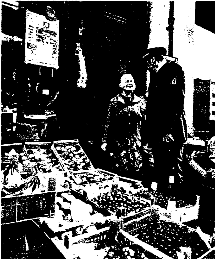
Berliner Kob: „Personifizierte Brücke des Vertrauens“?

Ich möchte regelmäßig zu den Plenumsitzungen der Initiative gegen das Einheitliche Polizeigesetz eingeladen werden.